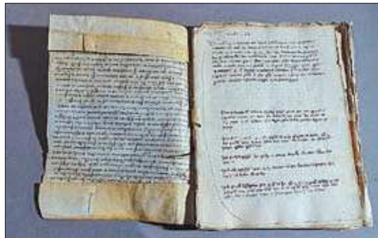
Un dels còdexs que s'ha de restaurar